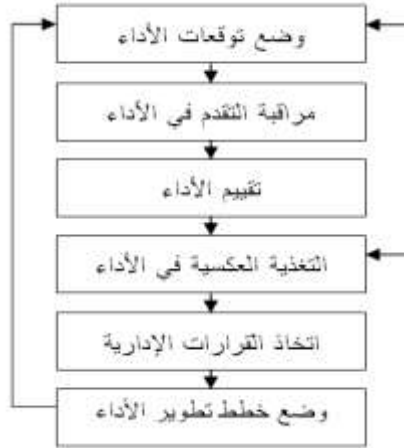
شكل (3): مراحل عملية تقييم الأداء الوظيفي