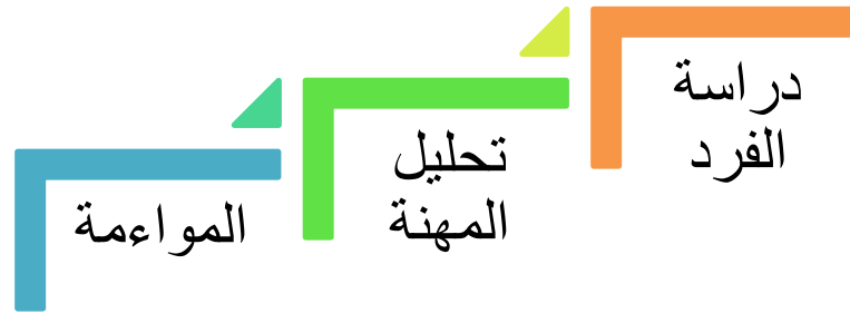
شكل رقم (1): مراحل التوجيه المهني

لا يمكن أن يكون التوجيه المهني ناجحاً ان لم يكن مدروساً وفق أسس ومبادئ ومراحل متسلسلة، تبدأ بدراسة الفرد وتمر بتحليل المهنة وتنتهي بالمواءمة بينهما: