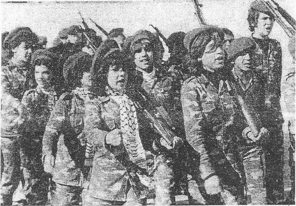
أشبال وزهرات، فتيان وفتيات ، أثناء التدريب ( مختلط ) - مخيم شاتيلا - ١٩٨٠م