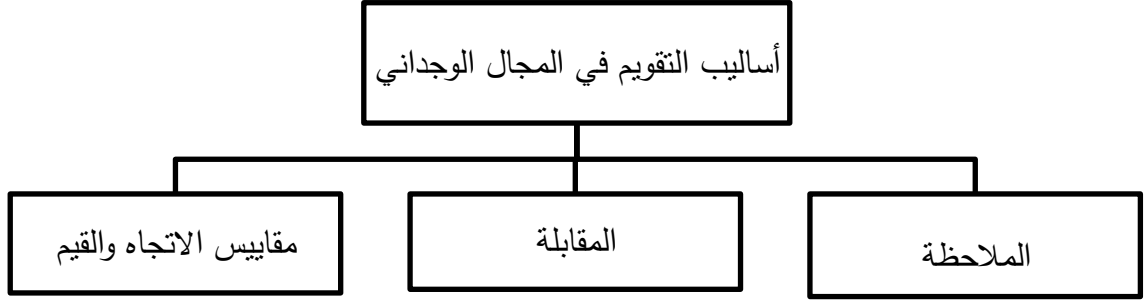
شكل (2.2): أساليب التقويم الوجداني